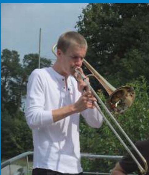
Weißwurst + Musik