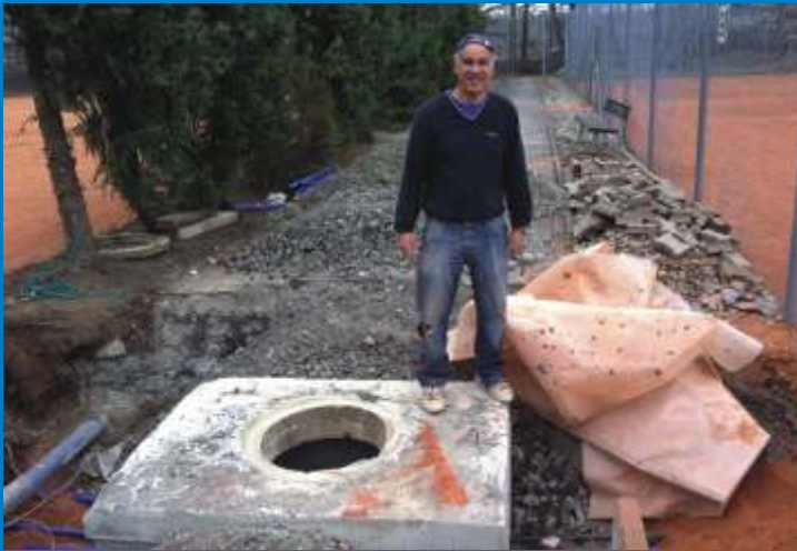
Herstellung neuer Wasseranschluß